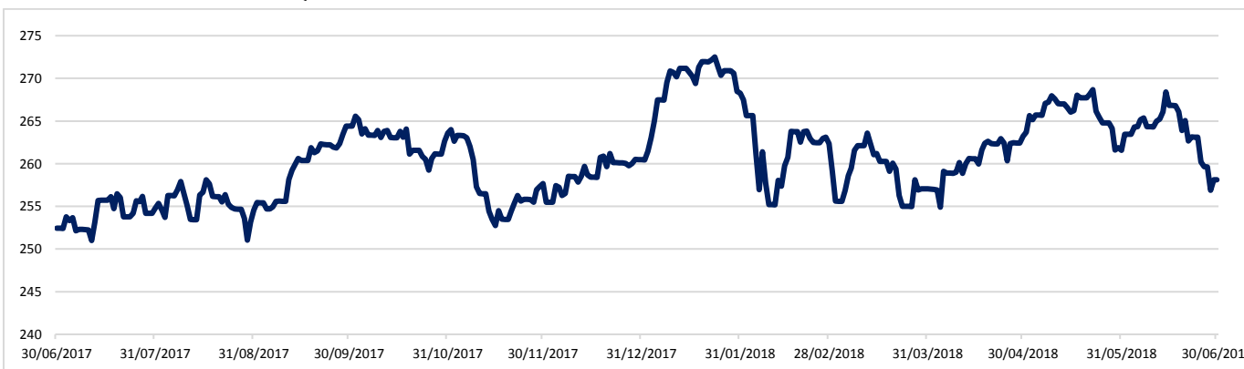
GRÁFICO EVOLUCIÓN VALOR LIQUIDATIVO MG LIERDE FP